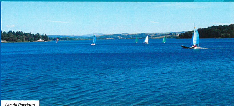
Lac de Pareloup

📍 Situation : Depuis Arvieu, prendre la direction barrage de Pareloup par la D4 56 puis la D4 577. Parking : se garer avant l'accès au bureau du SI à la plage Arvieu-Pareloup