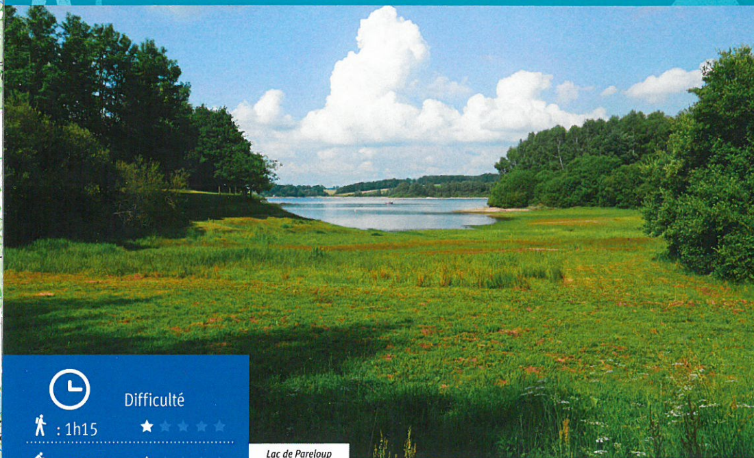
Lac de Pareloup